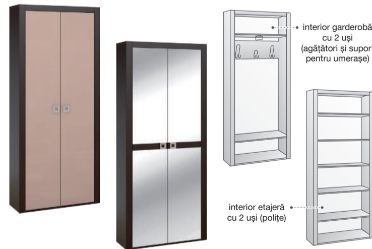
garderobă cu 2 uși garderobă cu 2 uși și oglinzi