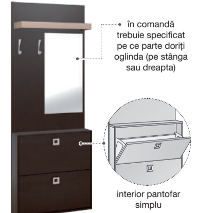
Kit L75/ H205 cm

Dimensiunile sunt prezentate în următoarea succesiune: L x A x H (lungime x adâncime x înălțime)