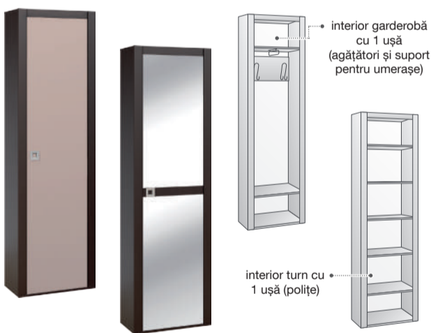
garderobă cu 1 ușă garderobă cu 1 ușă și oglinzi

ușa se poate monta cu deschiderea pe partea stânga sau dreapta