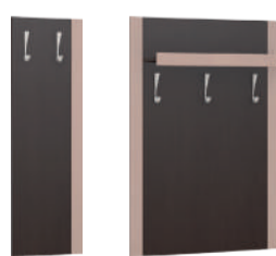
placă de cuier L34/ H115 cm (34 x 1,6 x 115 cm) placă de cuier L75/ H115 cm (75 x 26,2 x 115 cm)