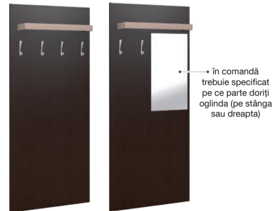
placă de cuier cu poliță L85/ H205 cm placă de cuier cu poliță și oglindă L85/ H205 cm